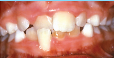
Mordida Anterior Cruzada